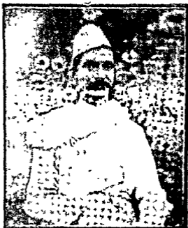
श्री. राजेन्द्रधामः १९२०